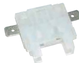
R1072 Porte fusible pour Fuse holder for fusible standard